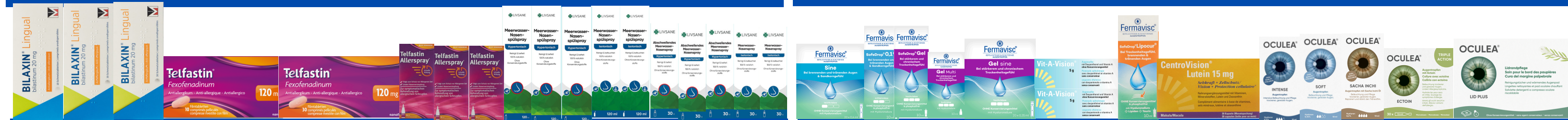
HEUSCHNUPPEN / RHUME DES FOINS / ALLERGIA