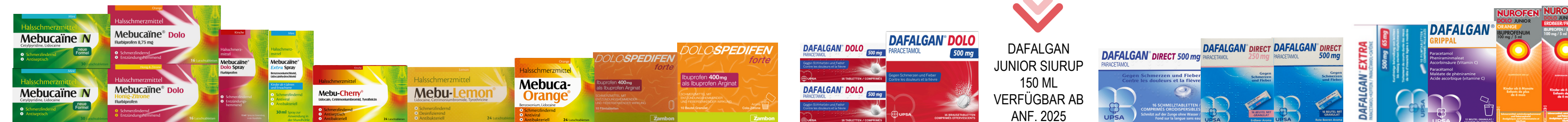
HALSSCHMERZEN / MAUX DE GEORGE / MAL DI GOLA