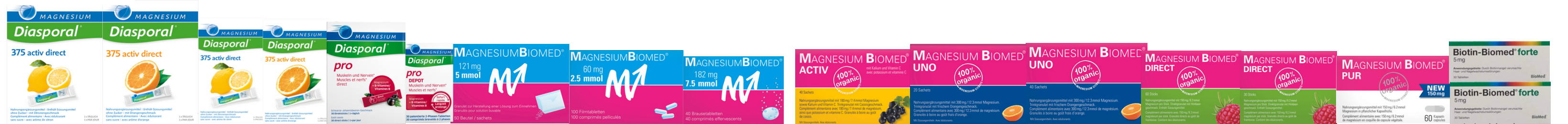
MINERALSTOFF / SUBSTANCES MINÉRALES / RICOSTITUENTI