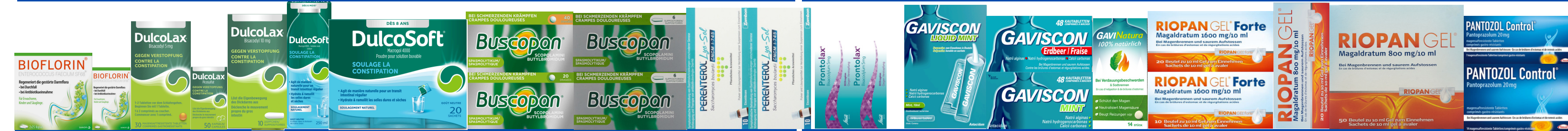
MAGEN-/DARMBESCHWERDEN / TROUBLES GASTRIQUES/INTESTINAUX / DISTURBI GASTRICI