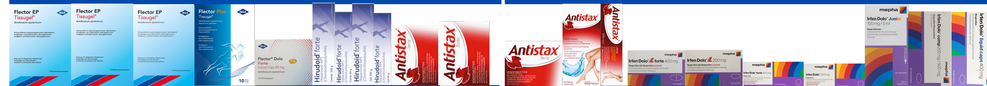
MUSKEL-/GELENKSCHMERZEN / DOULEURS MUSCULAIRES/ARTICULAIRES / INFORTUNI SPORTIVI